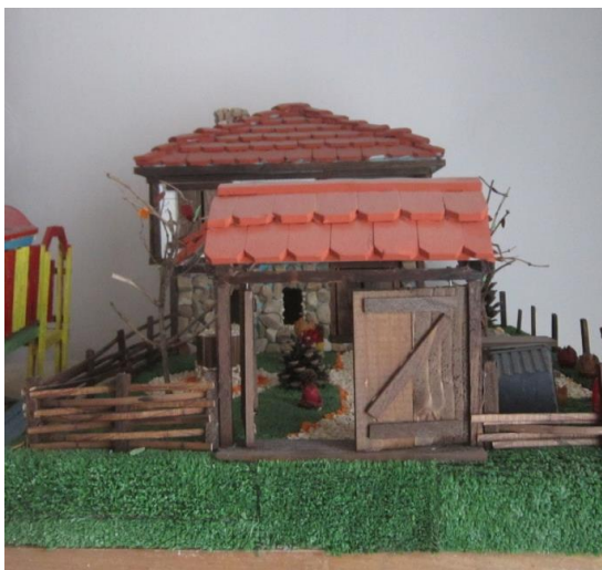
Макет на къща. Покривът е изработен от тарелки от сладки. Декорацията е изработена от пластмасови опаковки.

Безконтролното извърляне на непотребните пластмасови опаковки води до замърсяване на околната среда. Почти всички предмети за бита, играчки са направени от пластмаса. Вместо да се извърлят старите опаковки и да се купуват нови /дори и произведени след рециклиране/, хората да дадат нов живот на непотребните вещи и сами да си изработят изделия. Това ще предотврати отделянето на вредни емисии при рециклирането.